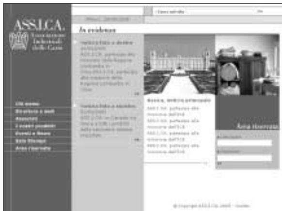
La home page del sito ASS.I.CA.

All'interno dell'attività di innovazione e razionalizzazione e degli strumenti per la comunicazione, sia rivolta all'esterno, sia rivolta agli Associati, riveste un ruolo decisamente importante il nuovo sito Internet dell'Associazione. Questo nuovo progetto ha permesso, in primo luogo, di rinnovare e aggiornare la veste grafica e i contenuti istituzionali del sito rivolto al pubblico. Ma la novità più rilevante non ha riguardato l'aspetto esterno del sito: www.assica.it utilizza oggi tecnologie avanzate che permettono