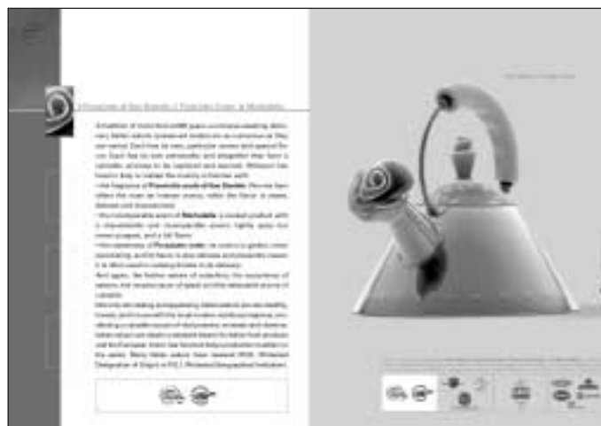
La brochure della Campagna “The taste of Italian Style”

La campagna stampa “The taste of Italian Style” - che ha abbinato le eccellenze dei cibi tricolore con il “design italiano”, altro elemento portante del made in Italy - è stata ideata dall’agenzia Cayenne ed è stata pianificata sulle riviste Gourmet, House & Garden e Saveur. Inoltre, è stata realizzata una brochure-ricettario per il consumatore, stampata in 4.000 copie e distribuita nelle diverse occasioni promozionali. La brochure, ha riproposto il tema dell’abbinamento con il design italiano presentato nella campagna.