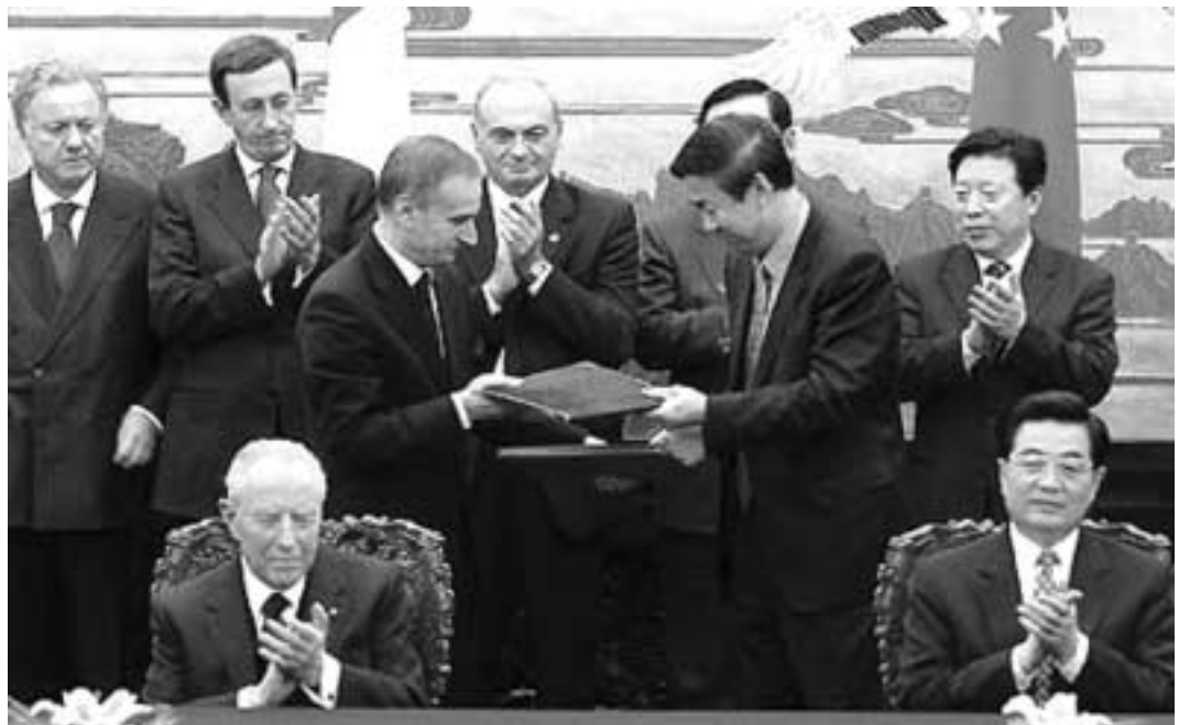
La missione italiana alla firma del Memorandum