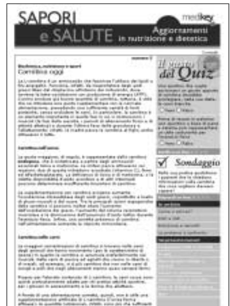
Newsletter elettronica Sapori e Salute