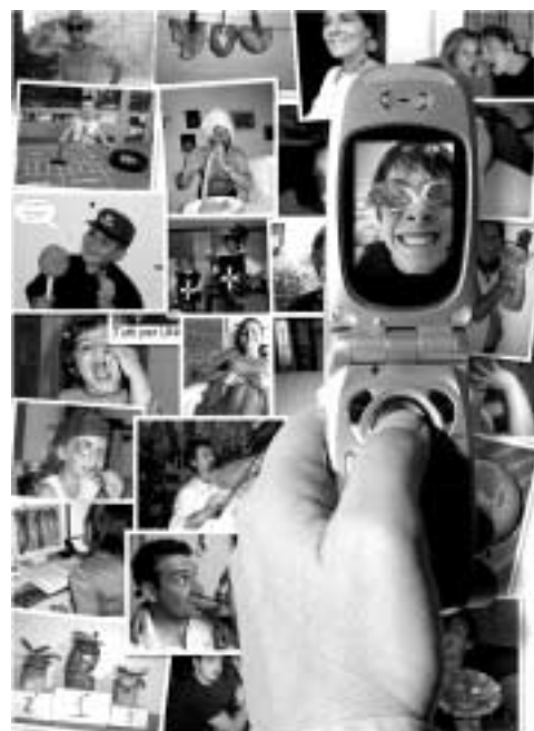
Concorso "Scatta chi gusta"

La visibilità di questa iniziativa è stata garantita, oltre che dagli MMS, da oltre 30.000 e-mail spedite a un target selezionato, dalla segnalazione sui principali siti dedicati a concorsi e giochi oltre che da azioni mirate di P.R. e Ufficio stampa radiotelevisivo che hanno prodotto una ventina di passaggi radio-TV (6 televisivi e 14 radiofonici). Oltre 9.000 voti sono stati espressi dai navigatori e si è registrato un notevole aumento di visibilità del sito www.salumi-italiani.it .