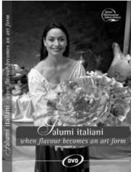
Copertina del DVD sui salumi italiani

Il girato delle riprese è stato opportunamente catalogato, per singolo prodotto, ed è la base, già ampiamente utilizzata, per favorire l'attività di P.R. radiotelevisive. Queste immagini, infatti, vengono messe a disposizione delle redazioni televisive che ne possono trarre "immagini di copertura" e sequenze neutre per interviste, servizi e reportage.