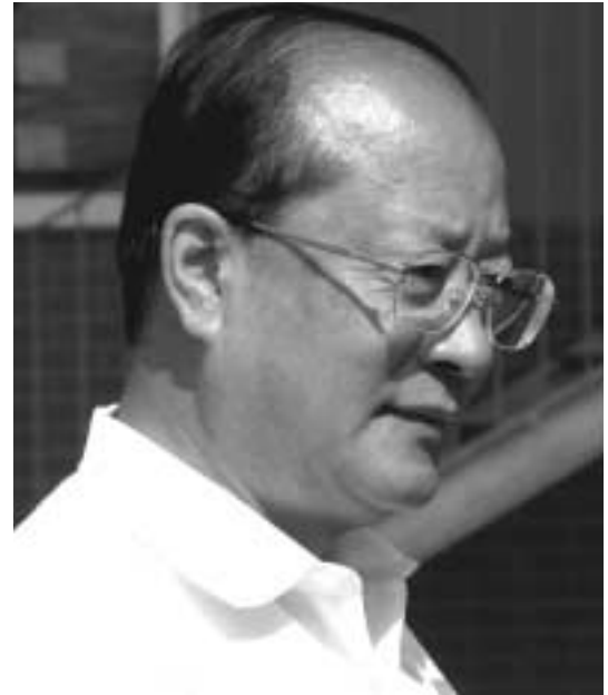
Il Ministro cinese della Sanità Li Changyang

sbloccato l'iter delle istanze dei nostri impianti di prosciutto crudo, secondo criteri condivisibili per l'intero settore. Nell'ambito di tale Missione, a coronamento di una specifica iniziativa dell'Ambasciata d'Italia Pechino, il Ministro cinese ha infatti visitato alcuni stabilimenti (prosciuttifici e salumifici) a Parma e San Daniele. Si è trattato di un evento di portata storica, reso possibile grazie al coordinamento realizzatosi tra ASS.I.C.A., Consorzio del Prosciutto di Parma, Consorzio del Prosciutto di San Daniele e Istituto per il Commercio Estero. Le Autorità cinesi hanno così potuto verificare, ai massimi livelli istituzionali, le garanzie sanitarie insite nel processo produttivo del prosciutto crudo italiano, prendendo visione dell'alto livello di specializzazione tecnologica dei nostri prosciuttifici sia a Parma che a San Daniele.