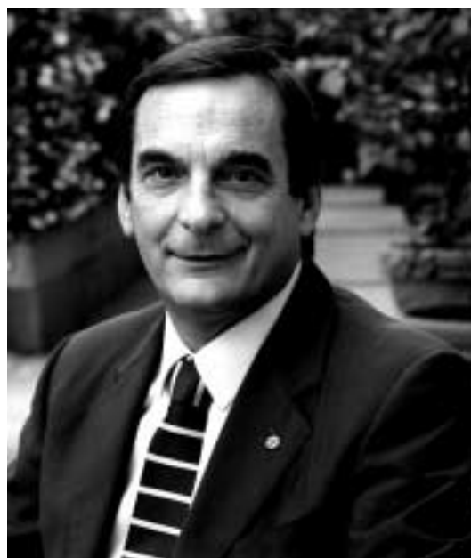
Il Presidente Francesco Pizzagalli

L'Istituto Valorizzazione Salumi Italiani (I.V.S.I.), delegato da ASS.I.CA. a svolgere l'attività di comunicazione, è chiamato sempre più ad esercitare un ruolo strategico e di fondamentale importanza per la crescita del settore, sia in Italia sia all'estero. In Italia, infatti, è compito dell'I.V.S.I. garantire al settore una buona visibilità e un clima favorevole verso i salumi e i prodotti carnei così da consentire il mantenimento dell'attuale fetta di mercato alimentare che il comparto ha saputo conquistarsi in questi anni. Accanto al presidio del mercato interno, l'Istituto agisce anche all'estero con iniziative di marketing collettivo volte a favorire la crescita oltre confine, diversificare i mercati di sbocco delle aziende del settore e aumentare così il bacino dei consumatori, mitigando la competizione interna.