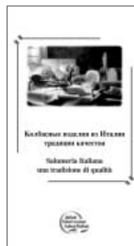
La brochure russa

Nel 2004 l’Istituto ha anche partecipato, dal 9 al 13 febbraio, alla fiera Prodexpo di Mosca, una delle vetrine alimentari più importanti della Russia, con uno stand espositivo, posizionato nell’ambito dell’area italiana. La partecipazione aveva una duplice finalità: presentare l’intera gamma della salumeria italiana, attraverso le degustazioni dei vari salumi offerte da un giovane promoter e la distribuzione di materiale informativo-promozionale in lingua russa; favorire l’attività commerciale delle aziende promuovendo l’incontro degli operatori italiani con quelli russi.