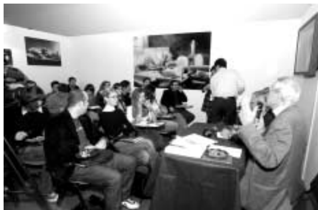
Eat Show al Salone del Gusto

Con questa iniziativa è stato sperimentato con successo un modello originale di interazione con i consumatori, i giornalisti e gli opinion leader, replicabile in nuove iniziative future.