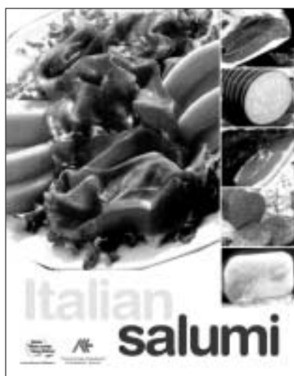
Il ricettario Italian Salumi

Nel novembre 2004, a New York, presso la Executive Dining Room della Condè Nast di Times Square, è stato organizzato un evento di presentazione dei quattro prodotti oggetto della promozione, finalizzato ad illustrare le differenze qualitative ed organolettiche delle produzioni italiane rispetto alle produzioni locali o estere presenti sul mercato e che ha visto la partecipazione di una settantina di giornalisti e operatori del settore. Inoltre, per presentare e far degustare i salumi e gli altri prodotti oggetto della promozione ad un target mirato, nel mese di dicembre sono stati organizzati tre seminari, nelle città di New York, San Francisco e Boston, e si sono organizzate delle settimane gastronomiche presso un paio di punti vendita Whole Foods Market e presso Grace’s Marketplace e Citarella, entrambi a New York. Infine, nel mese di dicembre si è svolta la